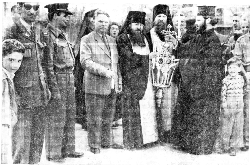
Получение благодатного огня на израильско-иорданской границе

Начальники и члены Миссии, назначаемые в Св. Град, обычно тягостятся своим послушанием. Трудно жить в чужой стране, где так мало